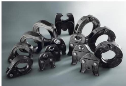
Figure 1 – Mâchoires et anneaux de sertissage Viega

Les mâchoires et les anneaux de sertissage marqués « VIEGA » sont préconisés. Les mâchoires et les anneaux de sertissage comportent également l'indication du diamètre. (Figure 1)